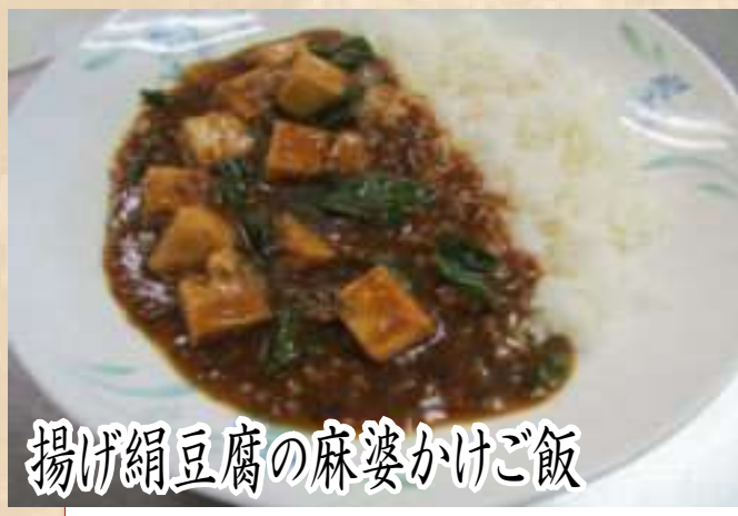
揚げ絹豆腐の麻婆かけご飯